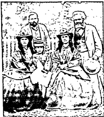
कार्ल मार्क्स, फ्रेडरिक एंगेल्स और मार्क्स की बेटियाँ - जेनी, लाउरा, एलेओनोर ।